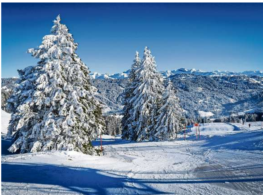
Genuss im Schnee: Die Haggenegg ist auch ein Wintermärchenland.

Ski- und Snowboard-Miete: Brunni Sport bei der Talstation Haggenegg, Telefon 079 423 09 03, www.brunnisport.ch