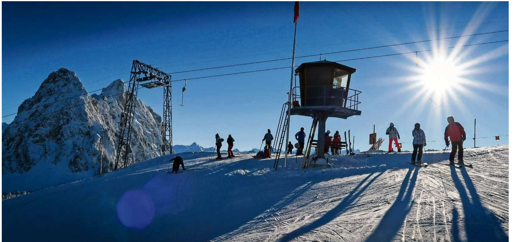
Bergstation auf dem sonnigen Nätschberg mit dem Haggenspitz und dem kleinen Mythen im Hintergrund.

Wir sind geübte Wintersportler und möchten mit dem «richtigen» Skilift zu Berge fahren. Die Tageskarte ist mit 38 Franken (Kinder 26) massiv günstiger als in den grossen Skigebieten. Wer eine Familientageskarte löst (nur Skilift Brunni und Zauberteppich; ab vier Per-